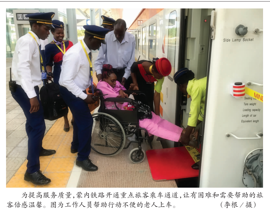
为提高服务质量,蒙内铁路开通重点旅客乘车通道,让有困难和需要帮助的旅客倍感温馨。图为工作人员帮助行动不便的老人上车。

搭乘蒙内铁路,车窗外的蓝天、白云、红土地和成片的金合欢树尽收眼底,经常可见一群佛佛正在护栏外玩耍,或者成群的斑马、大象在铁路旁的草地上悠闲自得,早已习惯这条呼啸而过的钢铁巨龙。