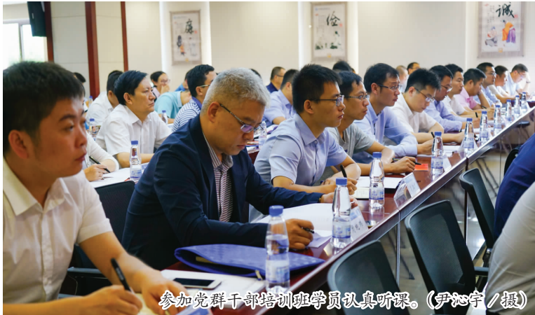
参加党群干部培训班学员认真听课。

何国民书记在本次培训班上指出,公司党组织是企业政治核心和领导核心,需要有一大批基层党务工作者通过扎实的党群工作,团结带领广大党员干部职工,为公司破解生产经营难题、完成急难险重任务、落实生产经营工作充分发挥作用。