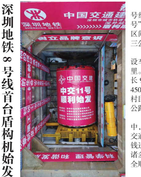
深圳地铁 8 号线首台盾构机始发

2015 年 11 月，4 标项目部成立了信息化领导小组，并参与了中交隧道局项目管理系统的工作。该系统通过对业主合同、劳务分包、工程量、材料、成本、进度、设备、质量、安全等方面的数据进行处理分析，监控整个施工生产过程，并为管理者提供工程进度、成本核算等信息，达到了强化质量管理、精细化控制施工过程的目的。财务共享系统则将项目所有财务处理工作集