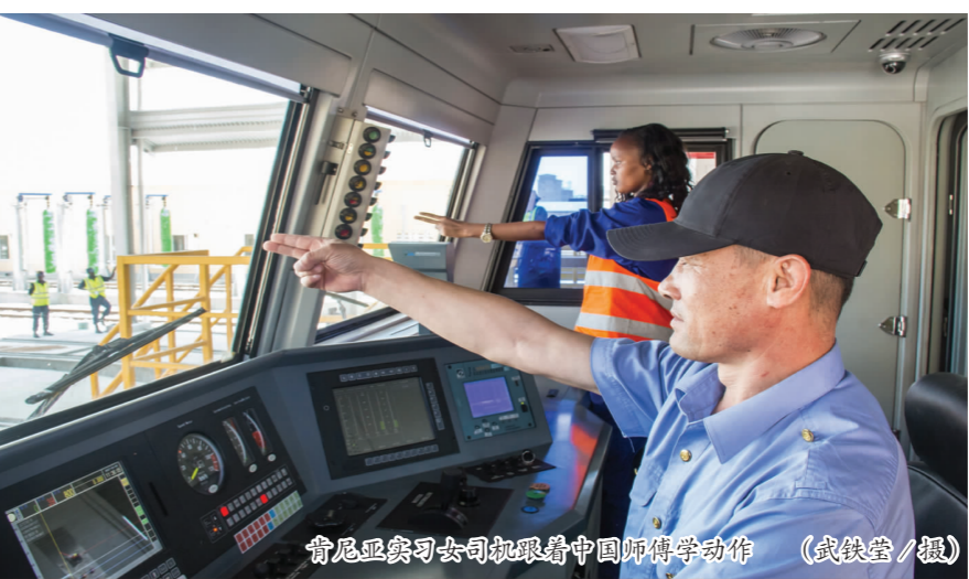
肯尼亚实习女司机眼着中国师傅学动作

列车驾驶室里，有一批特殊的驾驶员，她们就是被誉为“运营之花”的肯尼亚铁路运输事业的巾帼先行者——蒙内铁路的女司机。