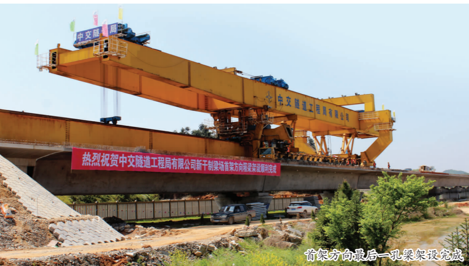
首架方向最后一孔架梁设完成

中交隧道局第五工程有限公司新干制架场项目部对施工现场进行了大量踏勘、调查。原规划占地为 225 亩，临近溧江镇，供电供水系统较完善，地基处理简单，无拆迁工程，且运梁距离经济合理。然而，由于占用耕地面积太大，工程完工后复垦困难，容易造成国家耕地资源流失或浪