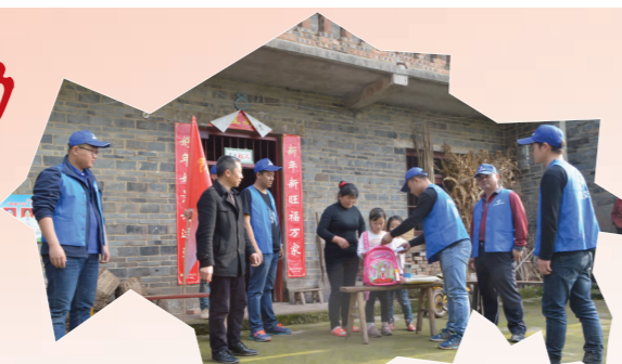
3月25日，五公司合长项目部“蓝马甲”志愿者们为当地留守儿童送去书包文具。