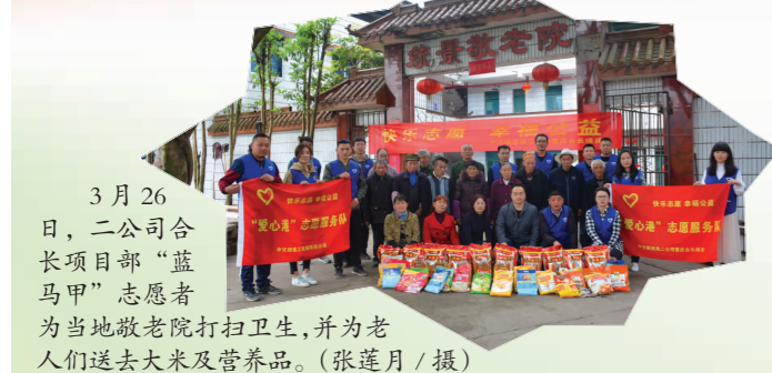
3月26日，二公司合长项目部“蓝马甲”志愿者们为当地敬老院打扫卫生，并为老人们送去大米及营养品。