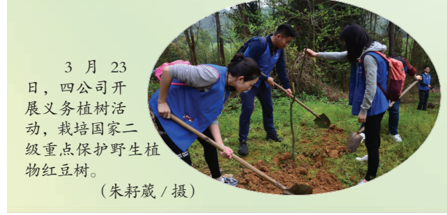
3月23日，四公司开展义务植树活动，栽培国家二级重点保护野生植物红豆树。