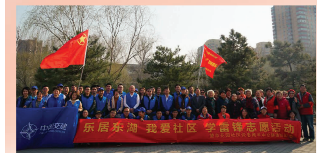
3月22日，公司团委联合当地社区党委开展首都“三清一普”环境整治学雷锋志愿服务活动。