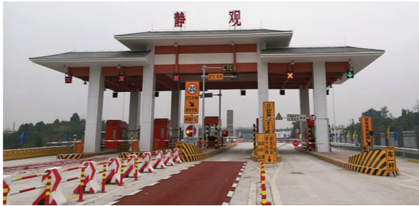
近日，电气化公司合长高速公路机电项目部参建的静观和三圣两个互通立交正式投入使用。

作为中国交建首个进入江苏省南通市城市轨道交通市场的单位，南京公司高度重视“中国交建”“中交隧道”品牌形象建设，优质高速推进各项工作。中标通知书下发当天，项目部班子成员进驻南通市，紧锣密鼓开展项目部组建工作，积极协调当地政府、轨道公司、产权单位等相关方，克服了车站周边环境复杂、绿化迁移、管线改迁、交通疏解困难等不利因素。一般情况下，从中标公示到首幅地连墙浇筑完成需要近1年时间，该项目部仅用了120余天，展现了“中交隧道”速度。（郑绪结 闫觅）