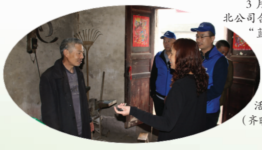
3月26日，华北公司合长项目部“蓝马甲”志愿者们慰问当地贫困家庭，为他们送去生活用品。