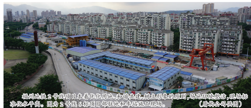
福州地铁2号线项目本着绿化用地、和谐共生、对农形象的原则，场地环境整洁，现场标准化水平高。图为2号线6标项目部驻地和车站施工现场。