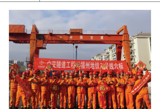
打造高效务实、团结向上的精良团队

在施工中，项目部克服了场地狭窄、工期紧张等困难，合理组织、科学规划，于全线22个车站中率先通过竣工验收。(简强林)