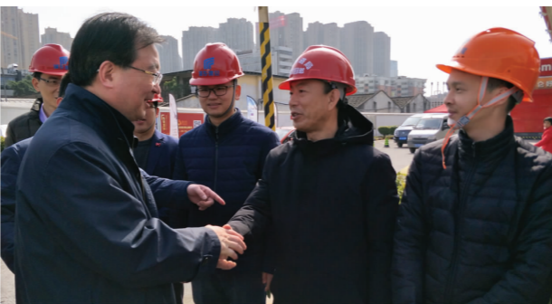
通车当天，福建省委常委、福州市委书记王宁（左1）到现场慰问四公司项目团队，称赞他们攻坚克难完成任务，“为推动福州新型城市化建设做出了积极贡献”。

近日，由四公司承建的福州市首条“穿山过河”地下公路——湖东路隧道顺利通车。 湖东路隧道全长1.9公里，下穿晋安河，是福州市第一条下穿隧道工程，其中隧道暗挖段围岩软弱、埋深大、地下水丰富，施工难度大，周边环境复杂。项目部精心组织，根据地质特点及时调整优化施工方案，规范施工，采用地表高压旋喷柱加固和真空井点负压降水等有效措施，实现了安全零事故、质量零缺陷的目标。 湖东路隧道的建成通车，将福州市鼓楼、晋安、鹤林片区串联起来，进一步缓解了城北片区的交通紧张状况，助推福州市金鸡山片区发展。（武乃林）