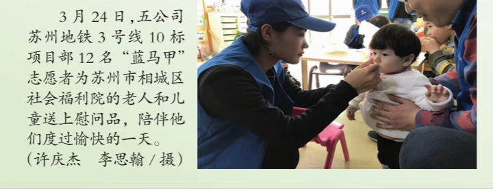
3月24日，五公司苏州地铁3号线10标项目部12名“蓝马甲”志愿者们为苏州相城区社会福利院的老人和儿童送上慰问品，陪伴他们度过愉快的一天。