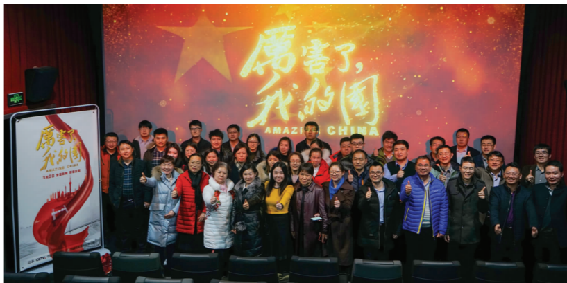
公司机关组织观看《厉害了，我的国》

国家每一项重大工程都凝聚了全国人民的磅礴力量，看到影片中鹤大高速公路的壮美画卷，我感到非常骄傲和自豪。短短几秒钟的镜头，让我又回想起在白山黑水战斗的光辉岁月，从进场之初