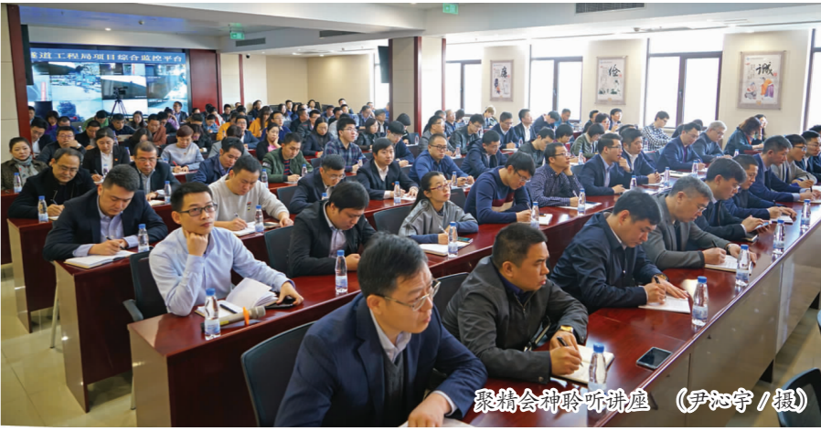
宣讲团成员聆听讲座

成为“行家里手”,不做“二传手”。面对新时代新要求,各级领导干部既要有做好工作的强烈愿望和十足干劲,也要防止“爱岗不敬业、敬业不专业”,克服“上热”的意识状态、缺少“上手”的知识能力,避免成为只能上传下达、在面上吹鸣的“二传手”。习近平总书记强调:“各级领导干部要加快知识更新,加强实践锻炼,使专业素养和工作能力跟上时代节拍,避免少知而迷、无知而乱,努力成为做好工作的行家里手。”始终把工作当学问做,在实践中培养专业精神、丰富专业知识,提高专业能力,坚持干什么学什么、缺什么补什么、做什么钻什么,有针对性地弥补短板弱项,知识弱项、能力短板、经验盲区,才能使自己真正成为专门家、主攻手。