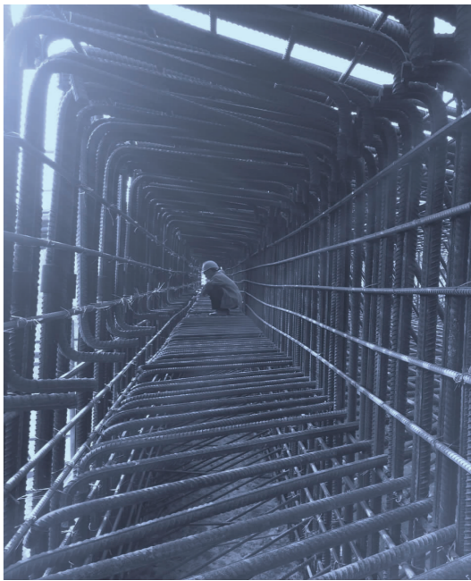
小空间，大作为

中心试验室连续两年获得全线试验室标准化管理考核评比第一名，被评为“标准化管理优秀工地试验室”，龙泉溪大桥被评为“安全文明标准化工地”，4号拌和站被评为“标准化管理优秀拌和站”，叶山隧道进口架子队被评为“优秀架子队”。相关人员获得“标准化管理优秀人员”“优秀分部经理”“征拆优胜个人”“优秀架子队队长”“先进生产者”等荣誉。（皇甫宇君）