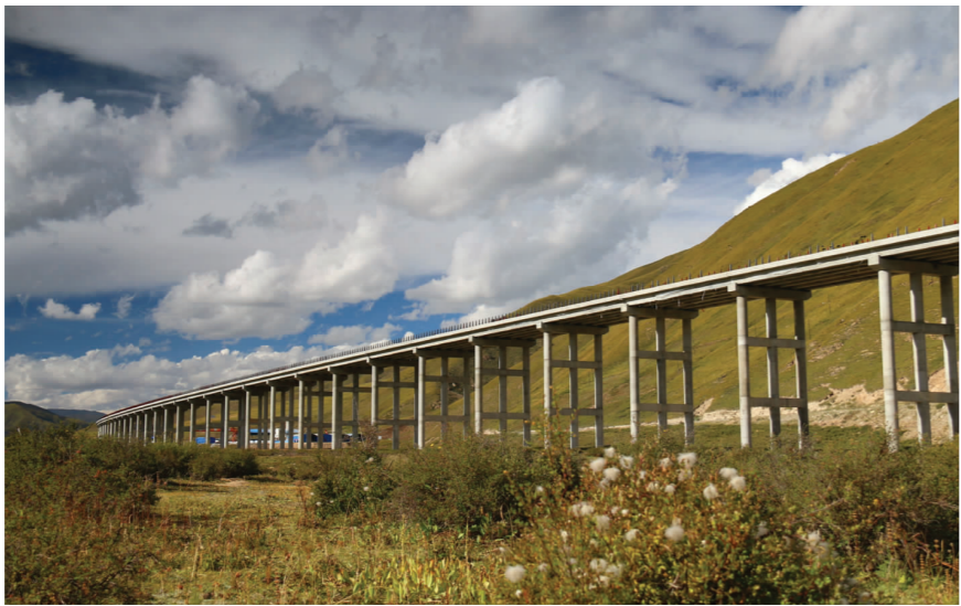
青藏高原上,新通车的花久高速公路穿梭于碧蓝蓝天之间,如一幅美丽画卷。图为二公司承建的马塞尔特大桥。

花久公路地处青藏高原腹地,全长389公里,横穿10个乡镇,经过高原多年冻土区域和一批著名旅游风景区,是西北地区首条绿色循环低碳示范公路。近日,该公路正式通车,公路盘亘于茫茫草原间,与周边生态环境融为一体,形成一道丰富多样的绿色景观。