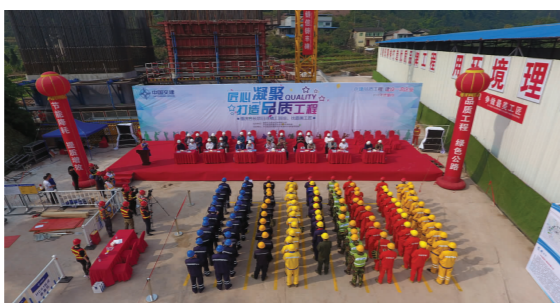
重庆合长项目开展“寻精工班组，找最美工匠”技能比武。

树立“中交隧道”品牌，就要打造精品工程，打造精品工程，必须大力弘扬劳模精神和工匠精神。3标钢筋班组经常丰富工作敬业，而且参与过隧道局多项大型工