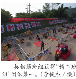
钢筋班组获得“精工班组”团体第一。