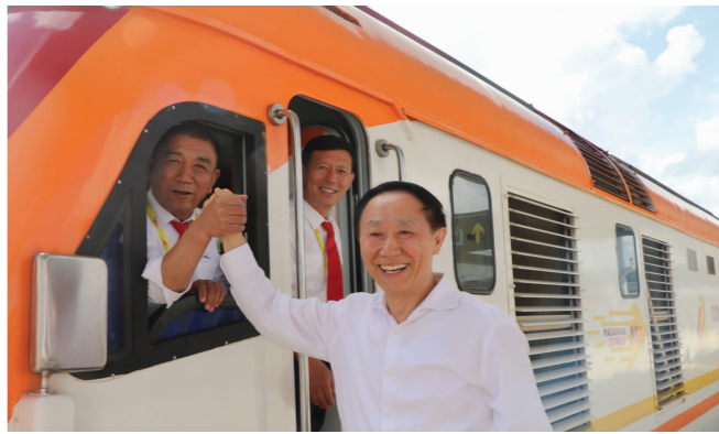
习近平主席特使王家瑞视察蒙内铁路运营工作，并与女司机合影。

王家瑞对蒙内铁路运营工作表示肯定，并提出了要求和期望：要掌握核心技术，确保行车调度安全；采取有效手段，严防动物侵袭；保持劲头，积极参与当地经济建设，进一步推动中肯友好合作。 (罗会志)