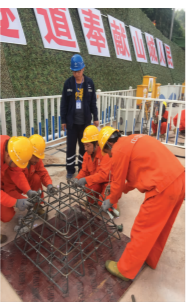
钢筋班组获得“精工班组”团体第一。